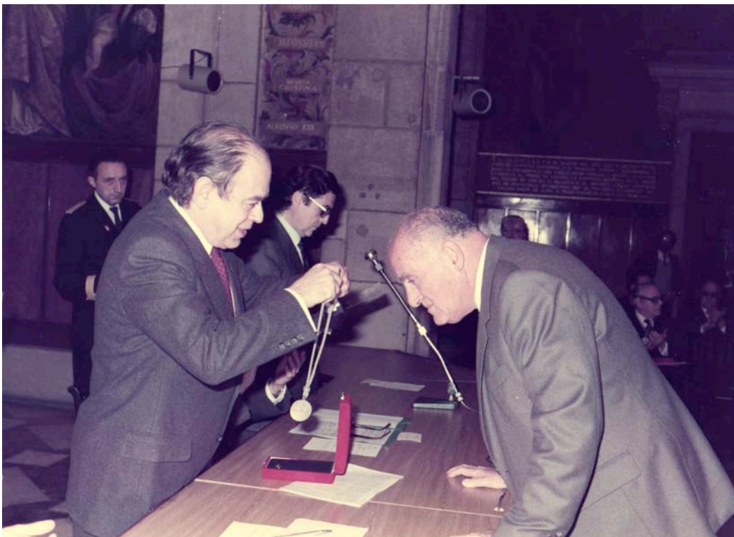
Medalla Narcís Monturiol (1983)